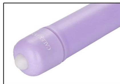
Łatwy w wyjmowaniu i wkładaniu bezczewodowy stymulator

Delikatność wprowadzania można zwiększyć przez zastosowanie razem ze środkiem nawilżającym na bazie wody. Ćwiczenie powinno się powtarzać przez kilka minut każdego dnia. Wzmocnienie mięśni można zauważyć już po kilku tygodniach stosowania.