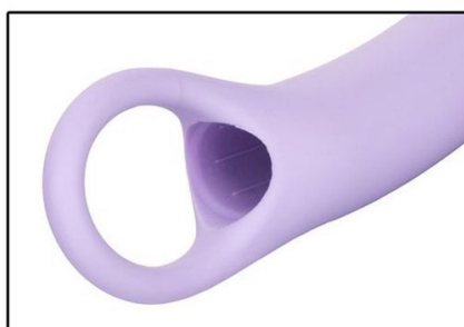
Pętla na palec dla łatwego wyjmowania